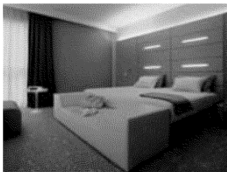
Le camere 135 camere più dieci suite