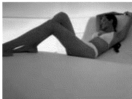
Beauty farm Palestra, estetica, centro medico